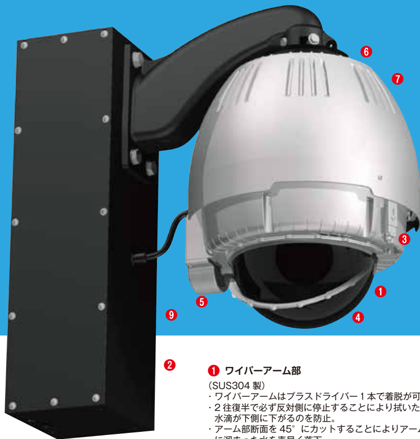
サンシールド無タイプ A-ODW7W シリーズ