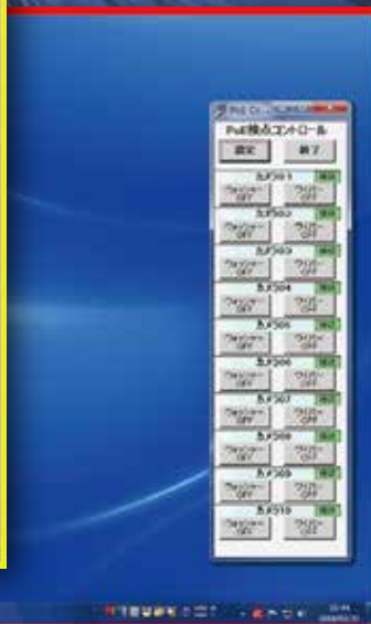
カメラ16台接続画面